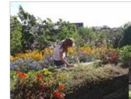
Schulgarten und Schülerpark